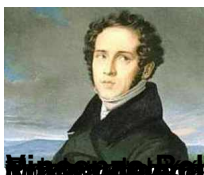
CASTA DIVA Norma

Sobota, 30 Lipiec 2011 19:20 - Zmieniony Czwartek, 19 Marzec 2015 16:30