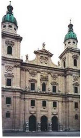
Katedra w Salzburgu

Niedziela, 08 Listopad 2009 09:18 - Zmieniony Poniedziałek, 16 Marzec 2015 20:17