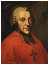
Książę Arcybiskup Hieronim von Colloredo

Mozart dosyć szybko wywiązał się z tego zadania. Wiosną 1779 roku napisał Vesperae Solennes de Dominica K.321