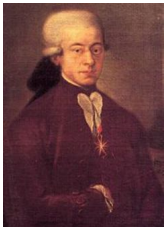
Mozart – portret z 1777 roku

W następnym roku Mozart skomponował Vesperae solennes ponownie. Struktura utworu