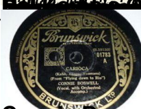
Connie Boswell, singel 1934